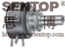
型号 CP22E (塑料外壳)